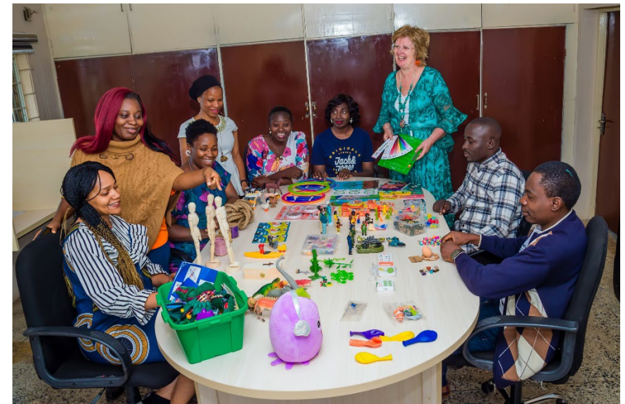
Deskundigheidsbevordering van de KicF staf met een nieuwe methode die toegepast an worden in counseling van getraumatiseerde kinderen