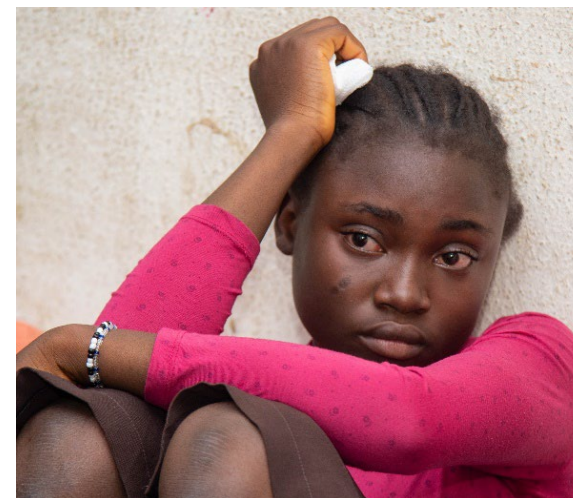
Een getraumatiseerd tienermeisje, die hulp gekregen middels het tienermeisjes project

Tienermeisjes in Nigeria leven in een omgeving waar kind huwelijken en tienerzwangerschappen lijken te zijn genormaliseerd, evenals ernstig en langdurig emotioneel, fysiek en seksueel misbruik. Meer dan 80% van deze doelgroep heeft te maken gehad met trauma. Een van de voornaamste doelstellingen van dit pilotproject is het bevorderen van het gevoel van eigenwaarde bij tienermeisjes, het stimuleren van onafhankelijkheid en het ontwikkelen van positieve levensvaardigheden die zij in de toekomst kunnen toepassen wanneer ze zelfstandig worden. We ondersteunen hen ook bij de ontwikkeling van hun emotionele en sociale vaardigheden, inclusief het cultiveren van gezonde relaties en het bevorderen van positieve communicatie. Het team van de KicF begeleidt de meisjes via groeps- en individuele sessies om zichzelf beter te leren kennen en waar nodig te werken aan hun trauma's. Deze eerste groep tienermeisjes, afkomstig uit een kindertehuis, wist eind augustus 2021 ternauwernood aan een moordaanslag in hun dorp te ontsnappen. In maart 2021 begon de voorbereidings- en ontwikkelingsfase van dit project. In november 2021 zijn we van start gegaan met twee groepen, bestaande uit in totaal 50 tienermeisjes. Al deze meisjes verblijven in een kindertehuis.