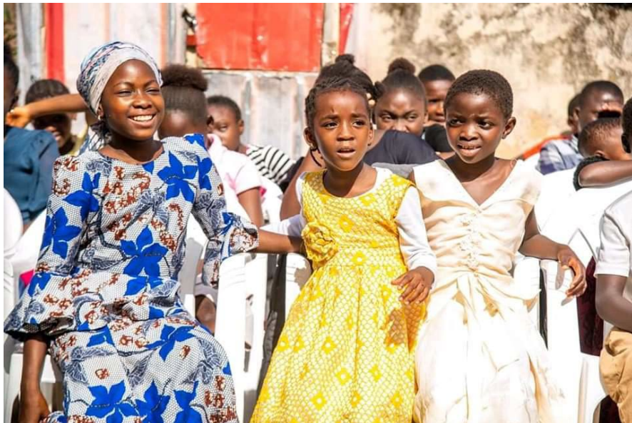
Een spelprogramma van de KicF met kinderen die gered zijn uit een grote aanslag op hun dorp