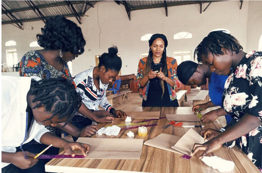
Creatieve therapie met de tienermeisjes