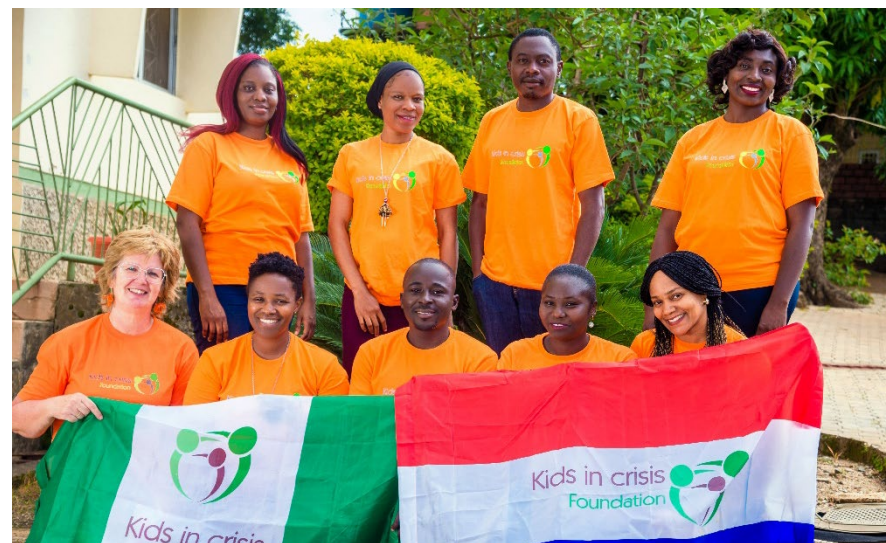
Team KicF voor het kantoor in Jos, Plateau State, Nigeria