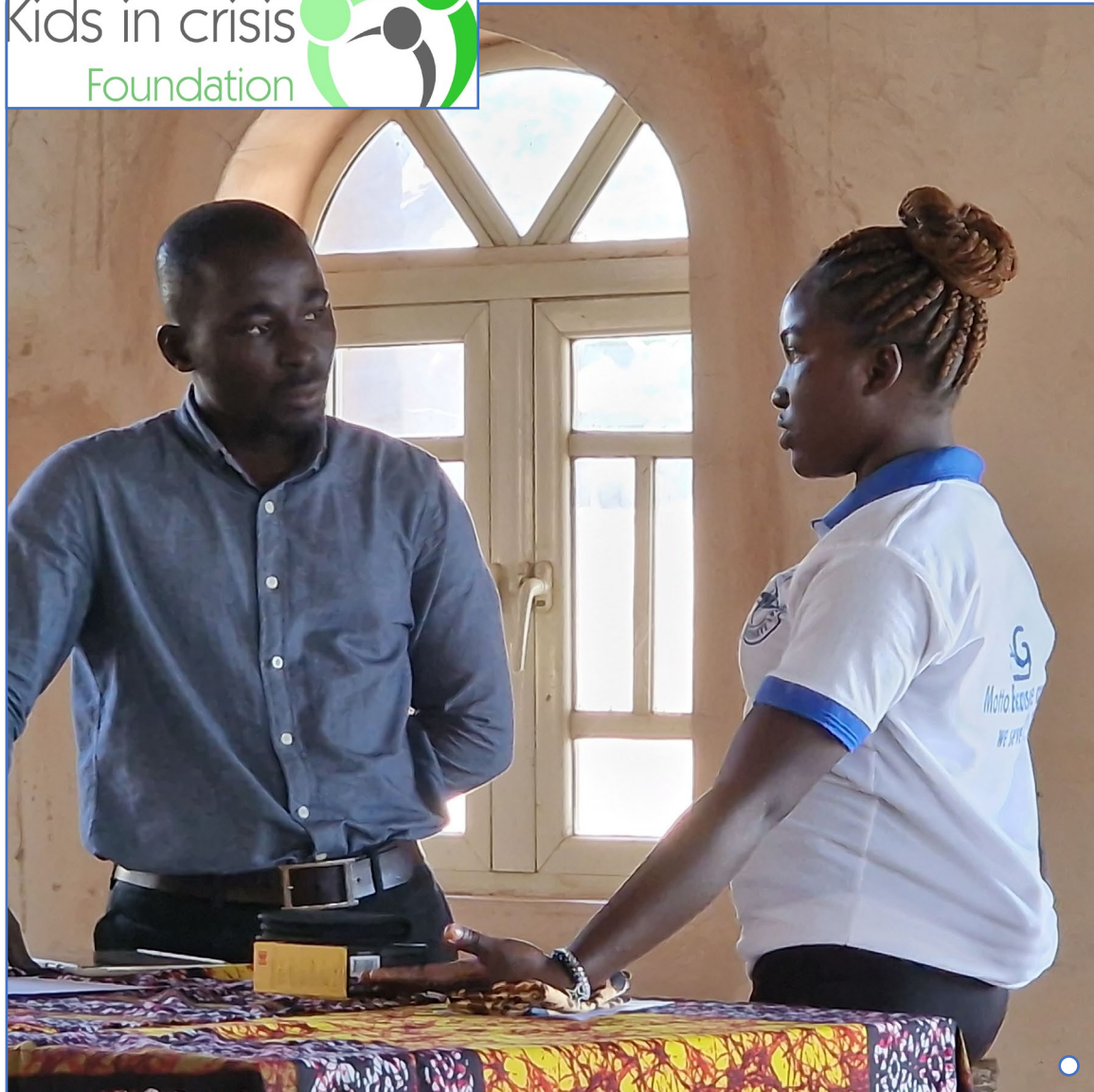
○ Counseling gesprek met een tienermeisje ○ ○