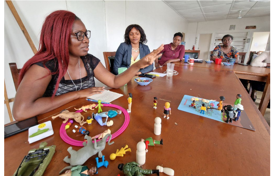
Deskundigheidsbevordering in communicatie met getraumatiseerde kinderen