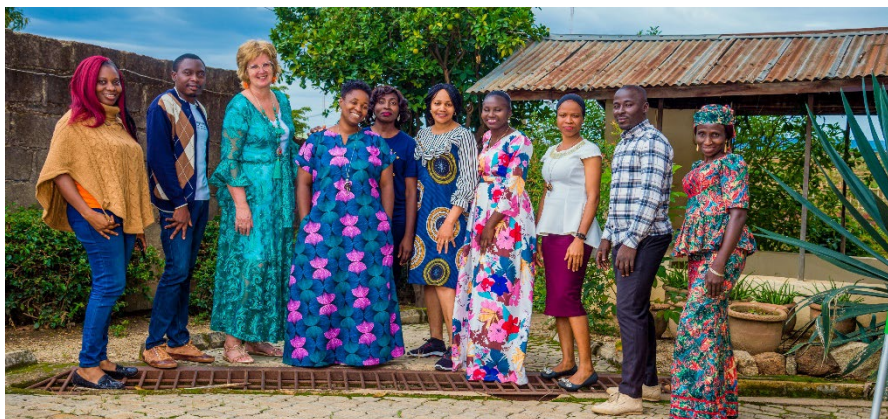
Team Kids in crisis Foundation Nigeria: trainers, psychologen/speltherapeuten en counselors

Mede namens al de kinderen zeggen wij Nagode (dank je wel in het Nigeriaans).