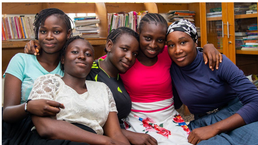
Deelnemers van het meisjesproject 'Her voice, her choice'. Een beetje weemoed omdat het de laatste sessies was van hun groep

Wij zien de financiering van het project 'Her voice, her choice' door stichting familiefonds Wierda Baas als een springplank om verder te gaan uitbreiden.