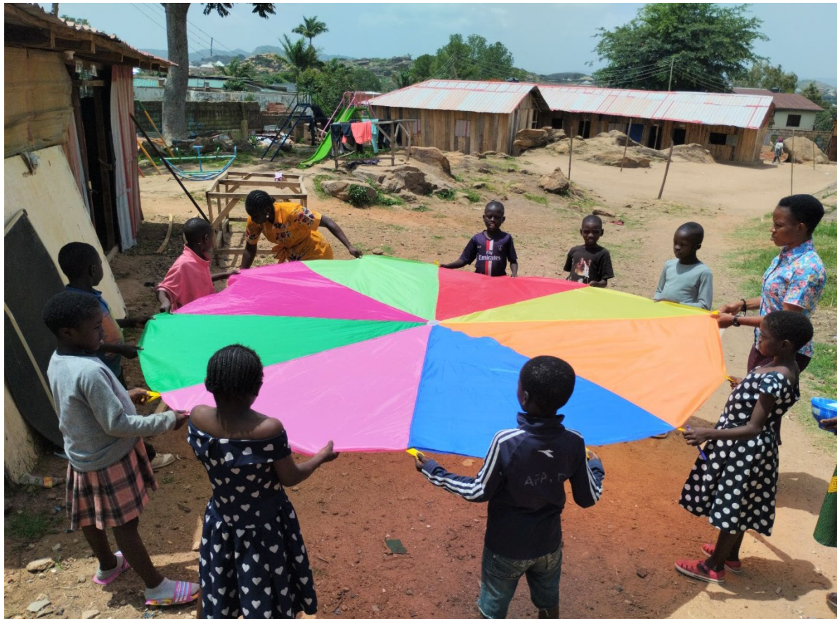
In alle trauma programma's maken wij gebruik van spel materiaal.

Als particulier mag u uw gift opvoeren als aftrekpost op uw inkomen.