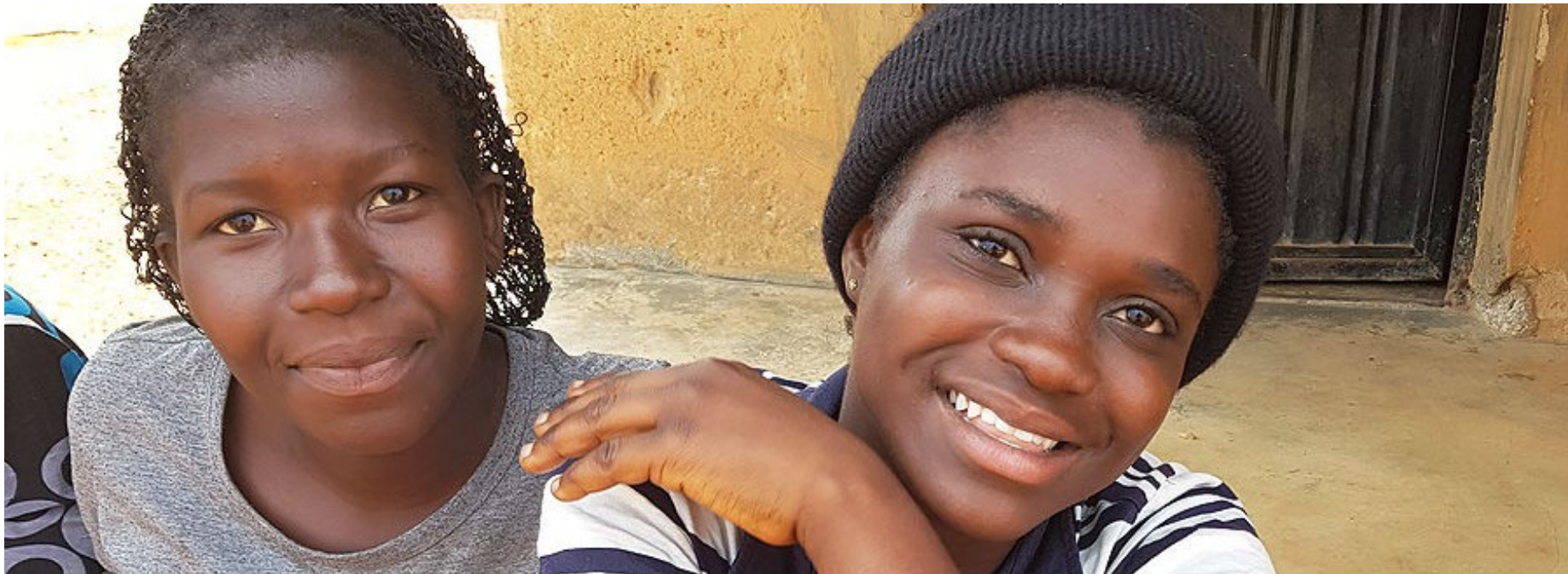
Onze counselors bouwen een hechte band op met de getraumatiseerde kinderen. Het kost tijd, maar dan ..... kan herstel gaan plaats vinden!

kinderen. Dit is ook van toepassing op de gehele staf van de school. Hierdoor ontstaat er een veilige en plezierige leer-, leef- en werkomgeving voor zowel de kinderen als de leerkrachten/hulpverleners. Voor de scholen klinkt bovenstaande mogelijk heel gewoon. In Nigeria is er sprake van een enorm grote achterstand in de ontwikkeling van leerkrachten en hulpverleners, zoals ook in project 'Trauma sensitive child counseling' in het kort is beschreven. Om een trauma sensitieve school te zijn of te worden moet men in Nigeria de kijk op leren en gedrag veranderen. In plaats van over kinderen te denken 'wat is er mis met jou' moet je denken: wat is er gebeurd waardoor jij zo reageert? Leerkrachten in een trauma sensitieve school hoeven geen therapeuten te worden maar wel meer ondersteuners op andere gebieden dan de gebruikelijke cognitieve vakken. De Kids in crisis Foundation start in augustus 2023 met de fondswerving voor dit grote project.