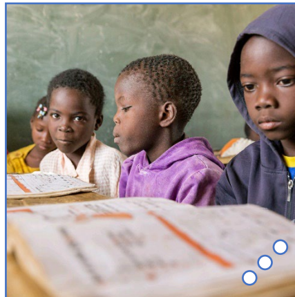
○ ○ Een lach aan de buitenkant, van binnen een ernstig trauma ○ ○